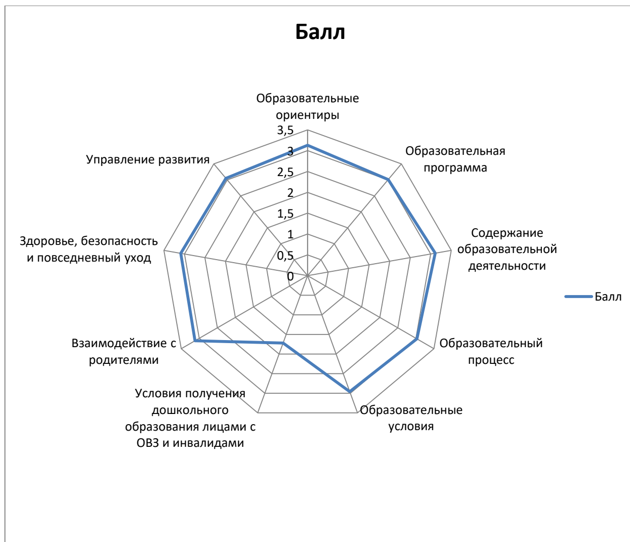
Рисунок 2. Внутренняя оценка качества дошкольного образования в Республике Калмыкия

Как показывает диаграмма внутренней оценки качества дошкольного образования в Республике Калмыкия, средняя оценка ДОО РК , принявших участие в апробации МКДО по 9 областям качества, по оценке педагогов равна 3 баллам . Сюда вошли такие области качества, как образовательные ориентиры, образовательная программа, содержание образовательной деятельности, организация образовательного процесса, взаимодействие с родителями, здоровье, безопасность и повседневный уход, управление и развитие. По этим областям согласно Шкалам комплексного оценивания - качество стремится к базовому уровню ФГОС ДО.